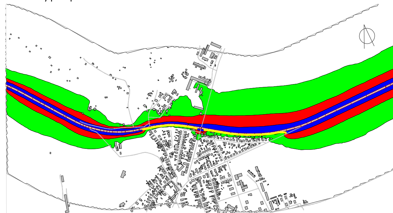
Konfliktný plán po realizácii PHC